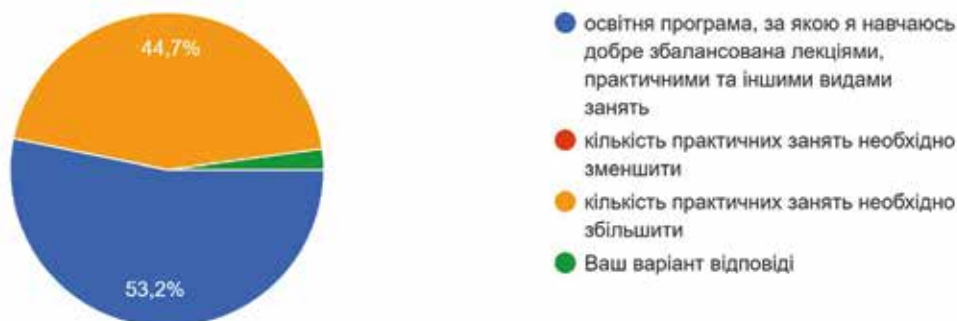
Рис. 2. Розподіл відповідей на запитання «Як Ви вважаєте, чи достатньо у Вашій підготовці практичних занять?» (щодо спеціальності 253 «Військове управління (за видами збройних сил)»)

Крім того, результати опитування представників роботодавців на запитання «Враховуючи Ваш практичний досвід, чи є необхідність змінювати форми та методи навчання для реалізації освітніх компонентів (навчальних дисциплін) науково-педагогічними