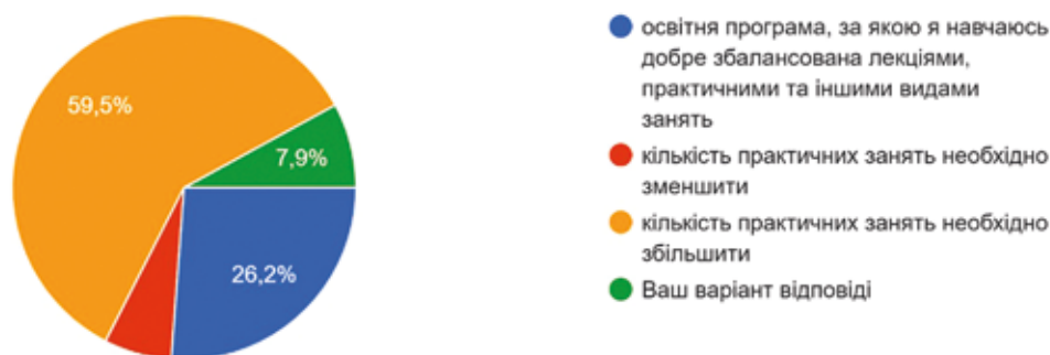
Рис. 1. Розподіл відповідей на запитання «Як Ви вважаєте, чи достатньо у Вашій підготовці практичних занять?» (щодо спеціальності 251 «Державна безпека»)

У Київському інституті Національної гвардії України приділяється достатня увага цим формам занять у поєднанні з удосконаленням залученої НМТБ. Однак опитування основних груп стейкхолдерів (здобувачів вищої освіти інституту та роботодавців) за підсумками 2023–2024 навчального року, яке було проведено у квітні 2024 року, засвідчує необхідність удосконалення практичних польових занять [13].